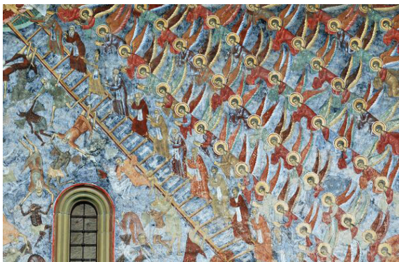
Reprezentarea Scării la Mănăstirea Sucevița.