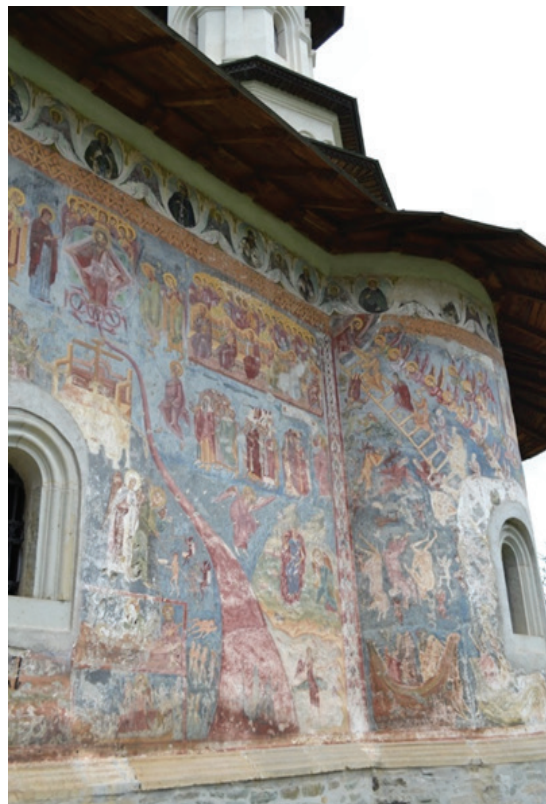
Reprezentarea Scării la Mănăstirea Sucevița.

Totodată, pe „treptele Scării de la numărul 22 până la 30 se face vădită taina iubirii. Îngerii cetui din față țin deasupra celor care rezistă pe drumul greu cununa fericirii. Ei, cei trei, comunică cu cei ce se exercită în trezvie. De deasupra treptei, din vârf, Fiul Omului iese din pătratul cerului în întâmpinarea celor ce s-au apropiat de El” [10, p. 165]. Specialiștii remarcă faptul că doar la Sucevița se observă o distanță foarte mare între ultimele trepte ale scării, făcând-o imposibilă de urcat, în sensul că ultimele trepte ale virtuții sunt cele mai complicate. Marcu Petcu remarcă în acest context că numărul treptelor prezentate în fresca de la Sucevița sunt 32, astfel, diferă de cele din lucrarea Sfântului Ioan Scărarul, „ultimele trei virtuți: Credința, Nădejdea și Dragostea sunt zugrăvite separat... Și întrucât acest detaliu are un scop foarte precis, în chiar acest interval (dintre treptele cu pricina) iconarii l-au zugrăvit pe unul dintre asceți căzut și atârnat de scară cu capul în jos” [9].