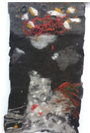
Des. 7. I. Savițcaia-Baraghin, „Autoportret”, tehn. mixtă, 1550x920 mm, 2016.