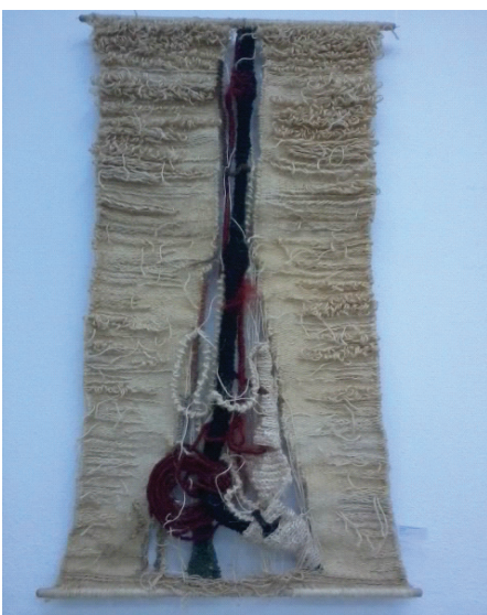
Des. 6. N. Zimbroianu, „Mlădițe”, tapiserie, sisal, pâslă, lână, tehn. clasică, 2150x1000 mm, 2015 (România).