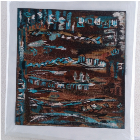
Des. 3. A. Gurețkaia, „Câmpul lui Poseidon”, tapiserie, tehn. clasică, 1000x1000 mm, 2012.