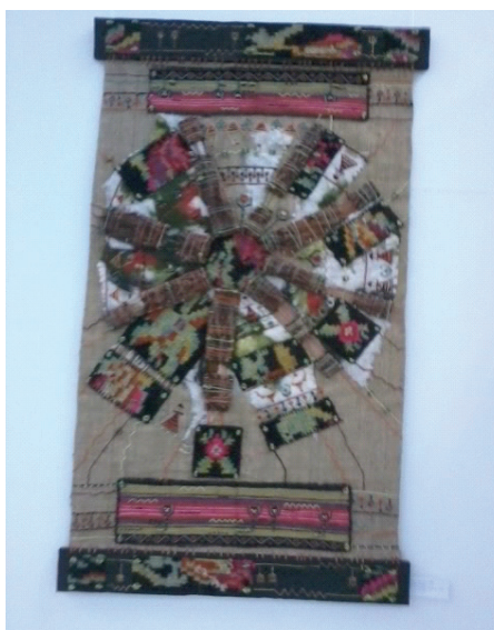
Des. 2. I. Burlaca, „Roata vremii”, pâslă, broderie, lână, tehn. mixtă, 740x1290mm, 2016.