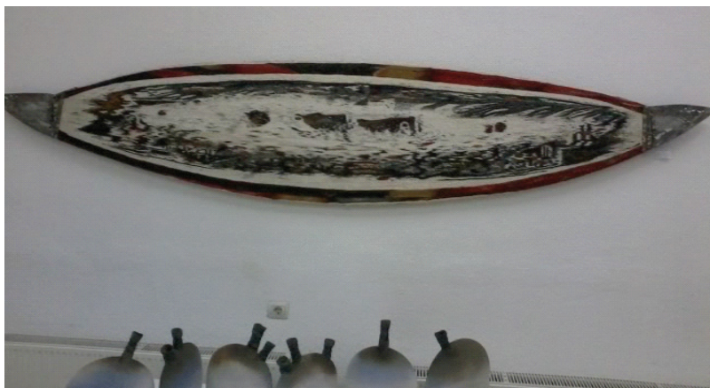
Des. 5. A. Gurețkaia, „Peregrinări”, tapiserie, lână, tehn. clasică, 2000x650 mm, 2015.