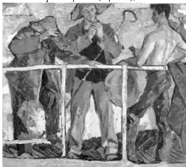
Figura 4. Greu Mihai. Stăpânii oțelului (Oțelarii), 1961