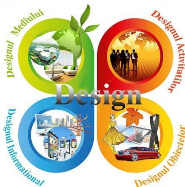
Figura 1. Tipologia designului

Noile tendințe în dezvoltarea designului sunt determinate de problemele stringente ale contemporaneității [10]. În acest context, după cum consemnează V. Medvedev în lucrarea Cu privire la structura teoriei designului [11], apare o nouă ramură în teoria designului – filosofia designului , domeniu științific în care se argumentează necesitatea investigării corelației unor astfel de fenomene de importanță mondială, precum: design – natură , design – societate , design – individ . Aceste direcții științifice sunt generate de obiectivele soluționării problemelor societății contemporane de amploare universală: pericolul și repercusiunile crizei ecologice , consecințele globalizării culturale , disconfortul psihologic al individului și sporirea maladiilor psihice în condițiile civilizației contemporane și „ exploziei informaționale ”. Prin urmare, în procesul interpretării științifice a designului se formează noi concepții: ecologică , etno-culturologică , antropologică . În mod similar se desfășoară paradigmele evolutive ale designului.