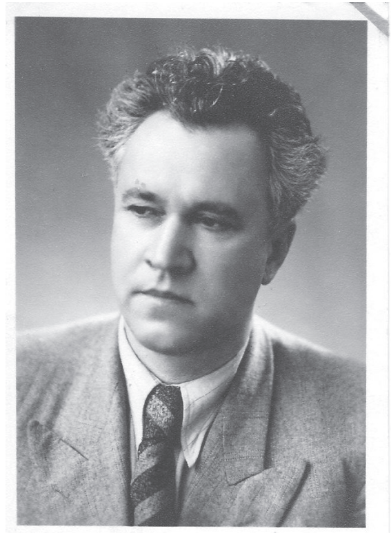
Tata Veaceslav Axionov (1900–1992)