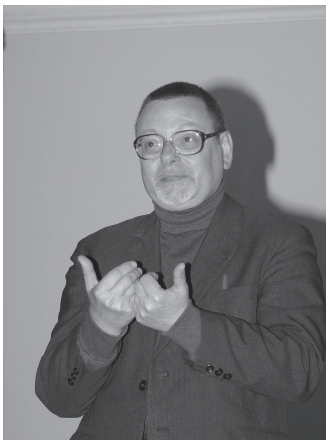
La Uniunea Compozitorilor și muzicologilor