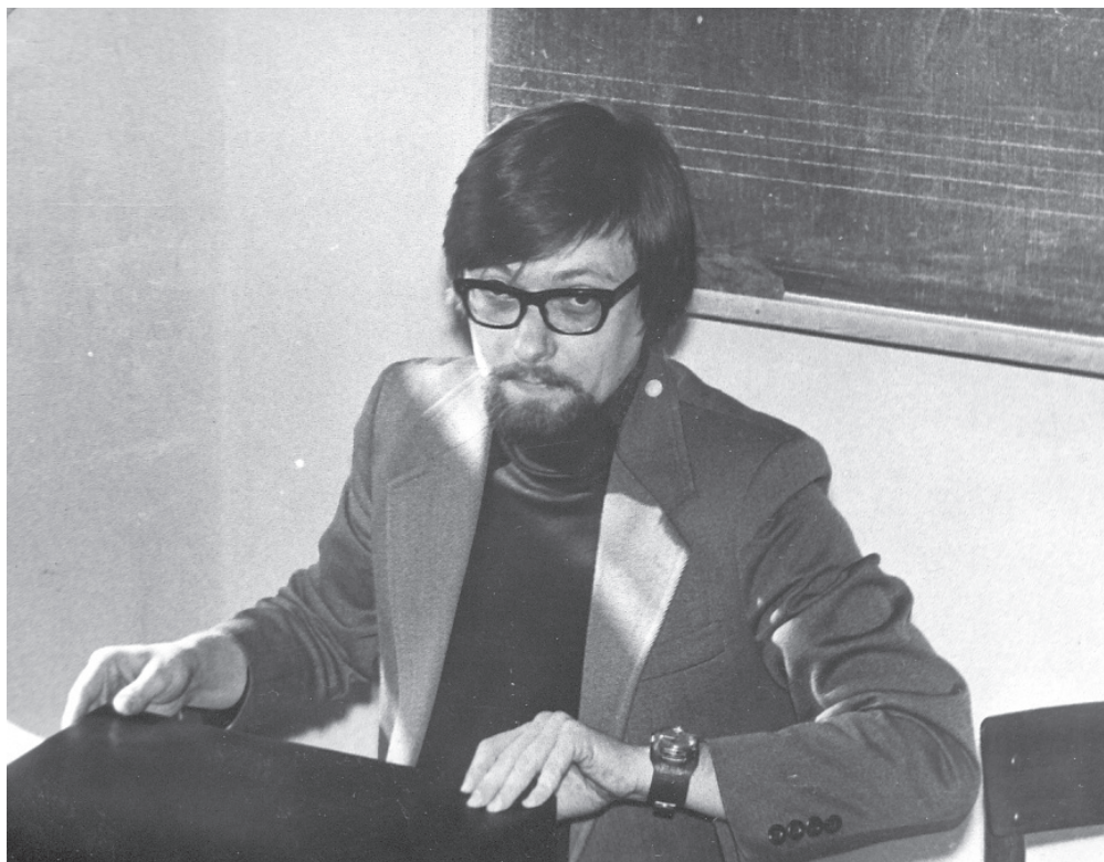
Tânărul profesor al Conservatorului din Chișinău