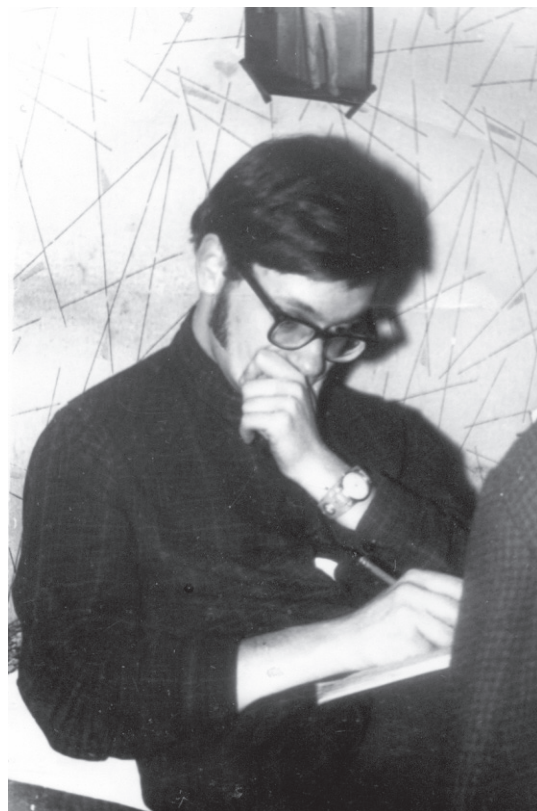
Student al Conservatorului P. I. Ceaikovski din Moscova