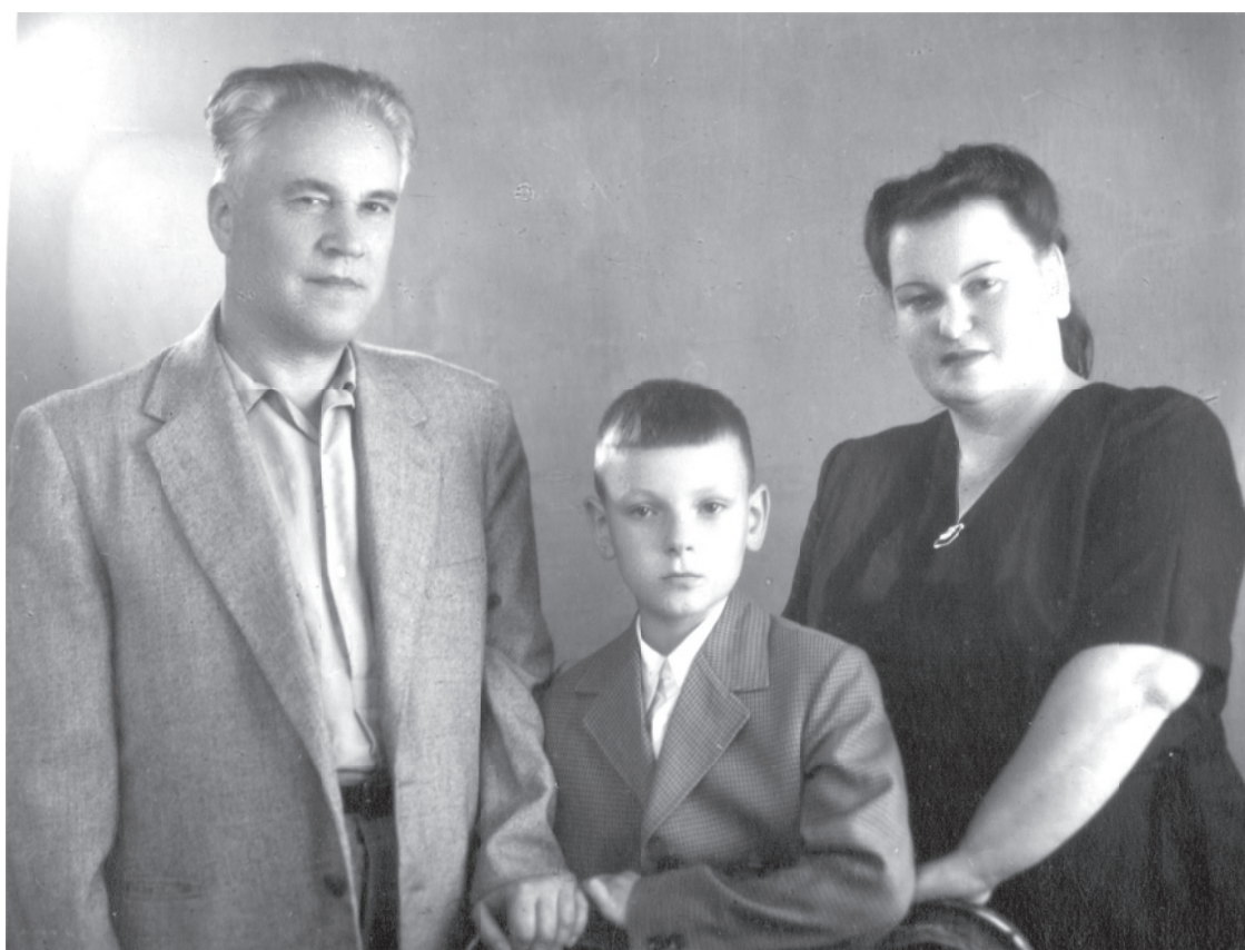
Împreună cu părinții (1960)