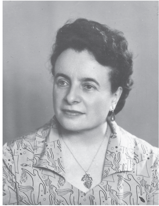
Tatiana Voitehovski (1915–1976)