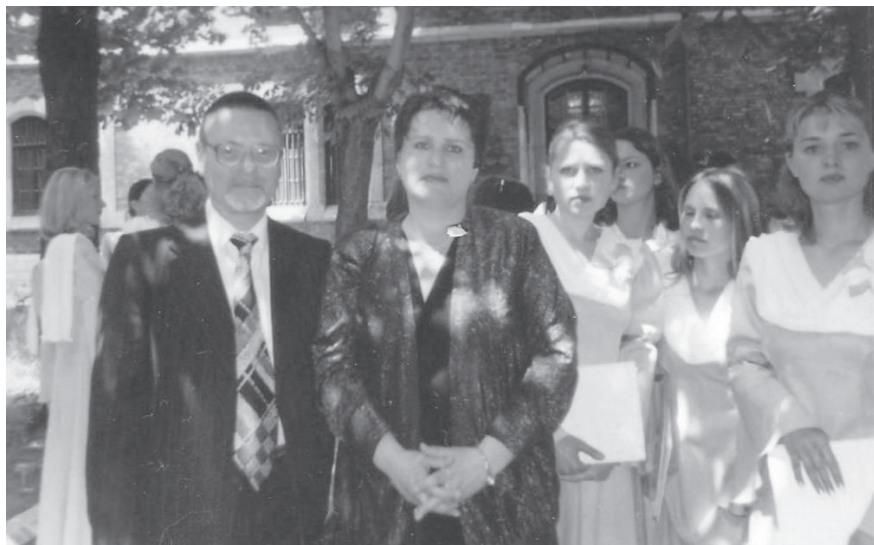
În Bulgaria cu corul Renaissance