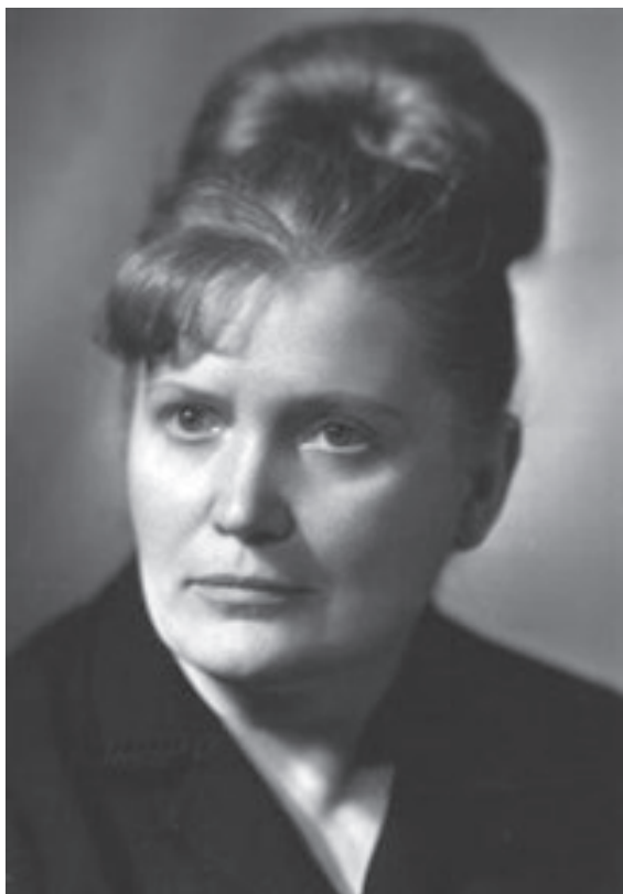
Nadejda Nikolaeva (1922–1988)