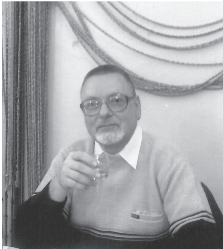
Aniversarea a 60 de ani