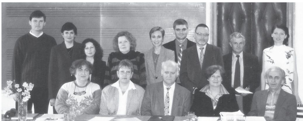
După susținerea tezelor de licență