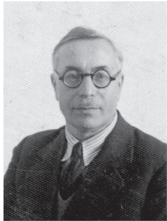
Alexandru Iacovlev (1881–1969)