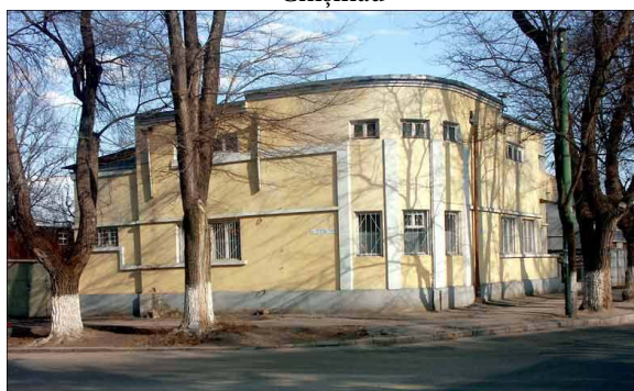
Figura 3. Clădirea din str. Sfatul Țării, nr. 2, Chișinău

Sursa: foto Leonid Dumitrașcu, 16.11.2018