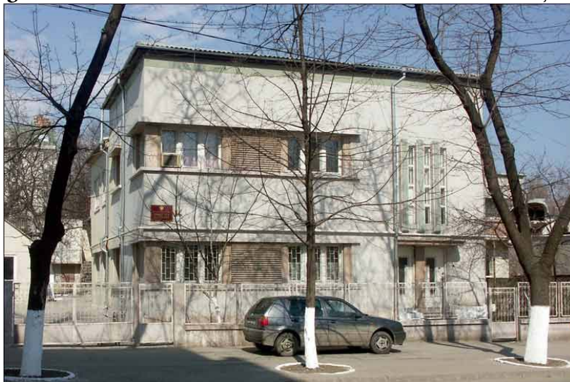
Figura 2. Vila urbană din strada Mihai Eminescu, nr. 33, Chișinău