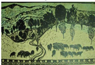
Figura 2. E. Romanescu. În poiană