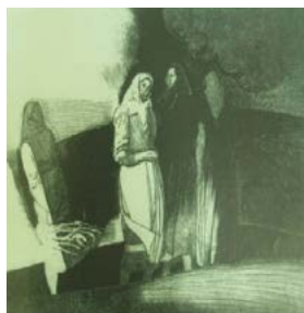
Figura 5. I. Bogdesco. Pe câmp.