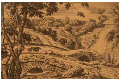
Figura 7. P. Șilingovski. Basarabia. Peisaj cu pod.