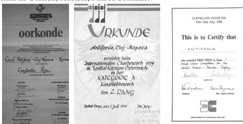
Figura 1. Premii în Olanda, Austria, Marea Britanie:

În anul 1982, Antifonia își încheie palmaresul competițional cu un binemeritat loc întâi la Concursul de la Europees Muzieek Festival Neerpelt din Belgia.