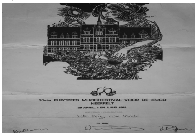
Figura 2. Premiul I, Belgia:

În anul 1982, Antifonia își încheie palmaresul competițional cu un binemeritat loc întâi la Concursul de la Europees Muzieek Festival Neerpelt din Belgia.