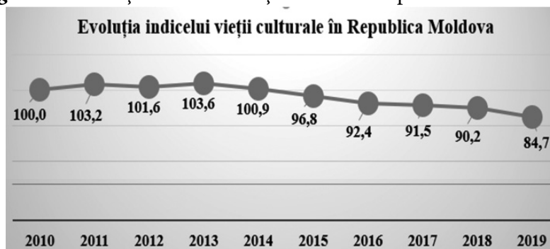
Figura 2. Evoluția indicelui vieții culturale în perioada 2010-2019.

Sursa: elaborată de autor în baza datelor statistice ale BNS.