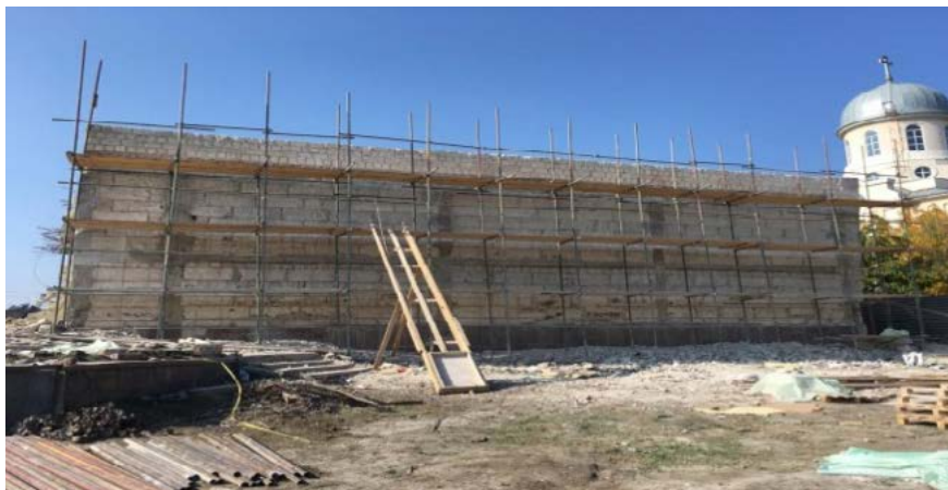
Figura 3. Aranjarea schelei pentru procesul de lucru la demontarea fațadei principale.

Sursa: foto Valeriu Jabinski, 15.10.2018.