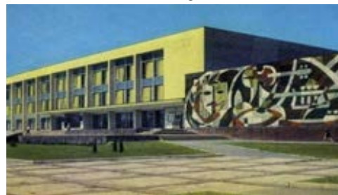
Figura 2. Palatul de Cultură al Sindicatelor deschis în anul 1972. Vedere centrală, peretele de est (fragment).