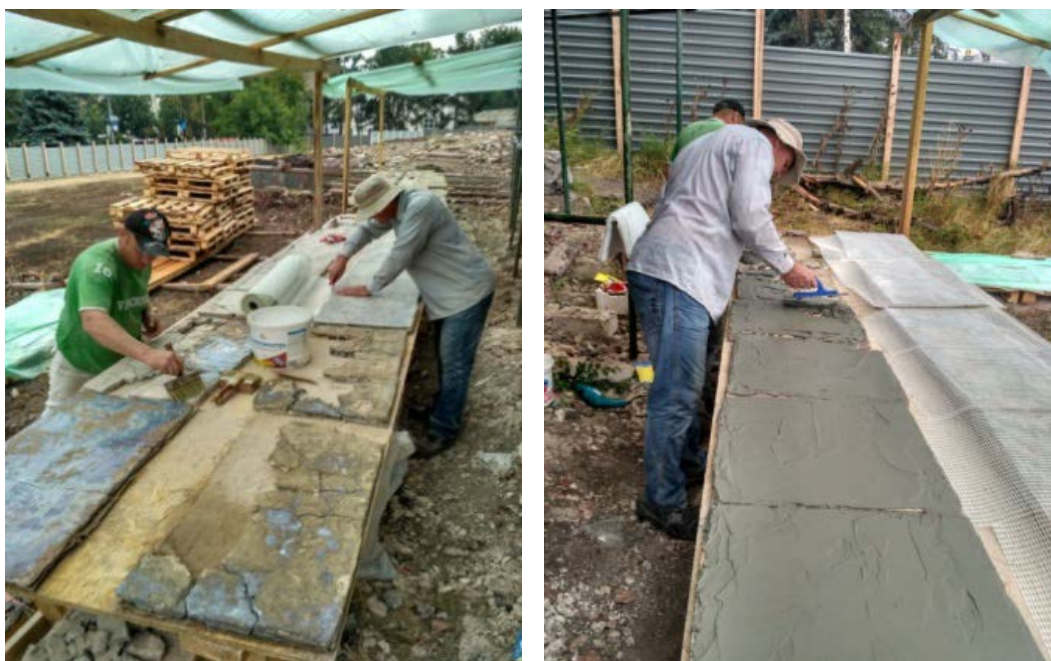
Figura 4. Proces de lucru la consolidare și conservare.

Pentru curățarea blocurilor de mozaic la sol au fost instalate mese de lucru. Cu ajutorul flexorului a fost înlăturat tot ce era în plus, păstrând grosimea patului mozaicului (2-2,5 cm). După curățare, suprafața a fost suflată de praf cu ajutorul compresorului cu aer comprimat și acoperită cu grund de pătrundere/penetrare adâncă. Pentru întărirea suprafeței și o mai bună aderență se adăuga adeziv pentru exterior de o grosime aproximativă 7-9 mm. Pentru păstrare și o aderență mai bună la montare, adezivul a fost armat cu plasă din fibră de sticlă de 320 gr și gravat ( Figura 4 ).