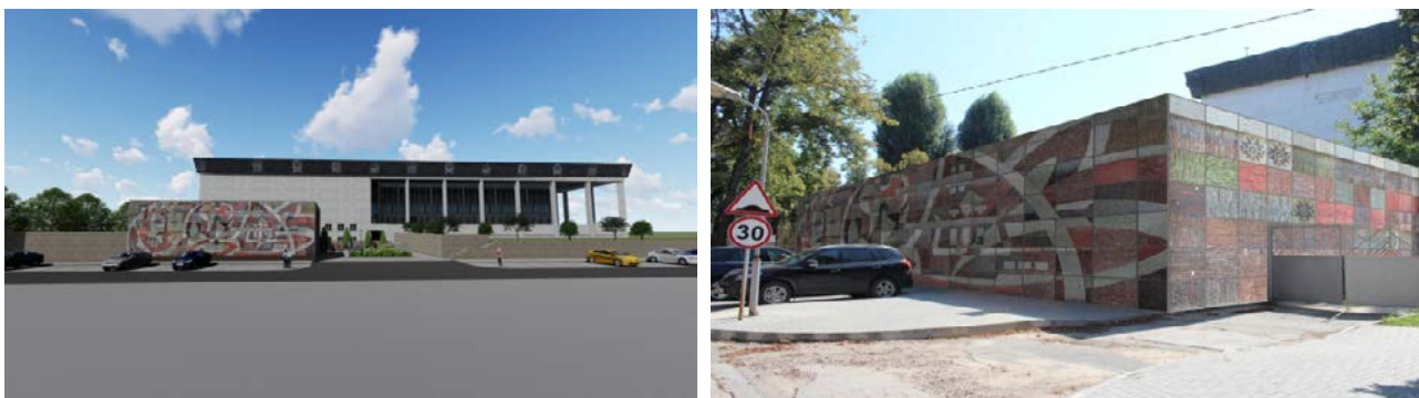
Figura 5. Proiect de reamplasare a panoului din mozaic Arta (Atributele artei) .