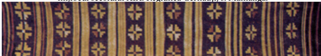
Figura 1. Lăicer îngust cu imaginea stilizată a petalelor de busuioc, mijlocul secolului XIX. Regiunea Cernăuți, s. Mămăliga.

Această variantă de floare de busuioc aplicată în decorul covoarelor basarabene este cea mai frecvent întâlnită, fiind observată deja în unele mostre de țesături la hotarul dintre secolele XVIII și XIX. Cel mai des, însă, motivul busuiocului se combină cu motivele stelei , roților focului și norului , ca expresie a dorinței de a avea roade îmbelșugate ( Figurile 2, 3, 4 ).