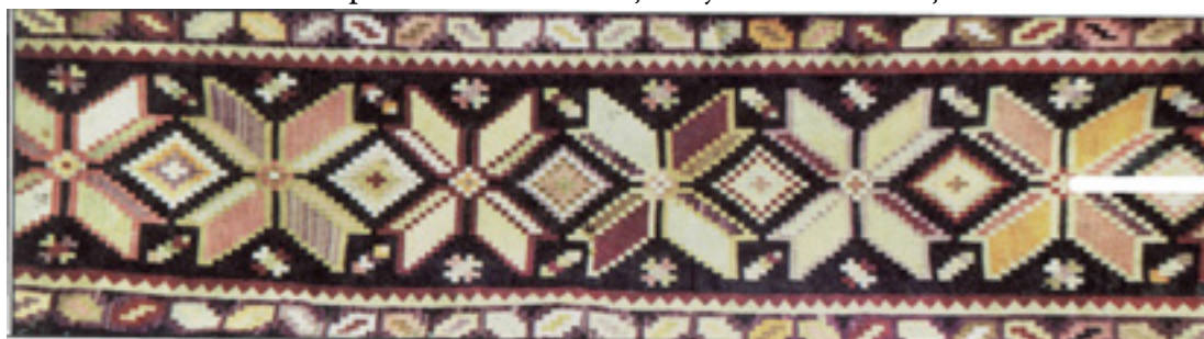
Figura 4. Fragment de război cu motivele roții focului (dreapta) și a norului mare (stânga), combinate armonios cu motivul busuiocului, foarte stilizată și văzută de deasupra, în proiecție frontală, sf. sec. XIX. Colecție privată.