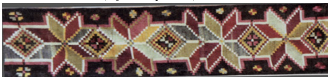
Figura 3. Fragment de păretar cu motivele morii, scaunului, și busuiocului, cu ancadrament perimetral de nourași, mijlocul sec. XIX, Ștefan-Vodă.