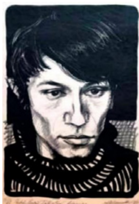
Sursa: colecția autorului, 32x25cm