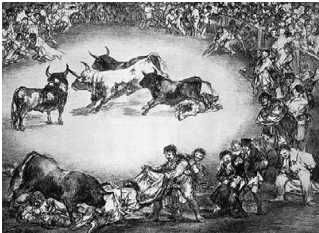
Imaginea 1. Francisco Goya, Taurii Bordeaux , 30x41cm, 1825