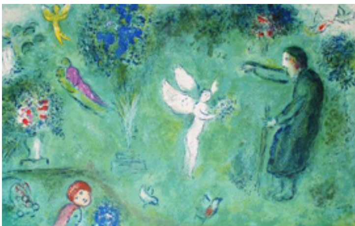
Imaginea 4. Marc Chagall, seria Daphnis și Chloe , Grădina lui Philetas , 41x64cm, 1961