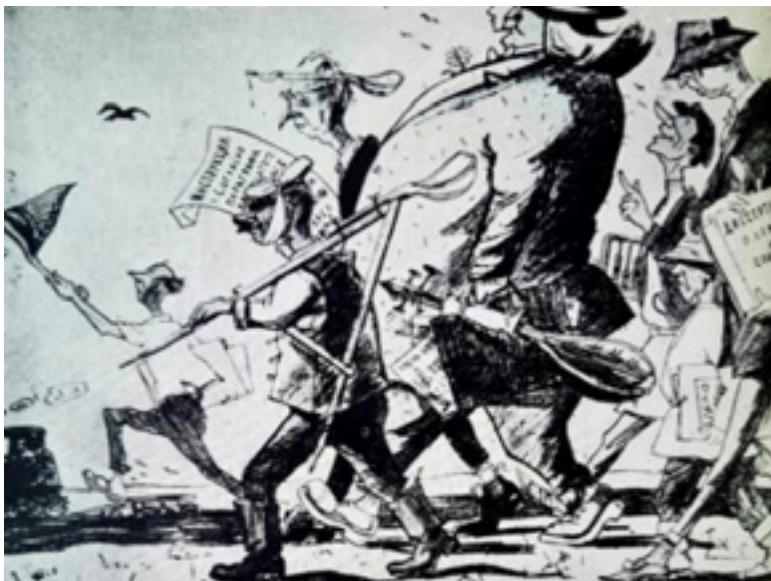
Sursa: Catalog. Prima Expoziție Republicană de Stampă. Autor: Rodnin K., Chișinău, 1966, 32x44cm