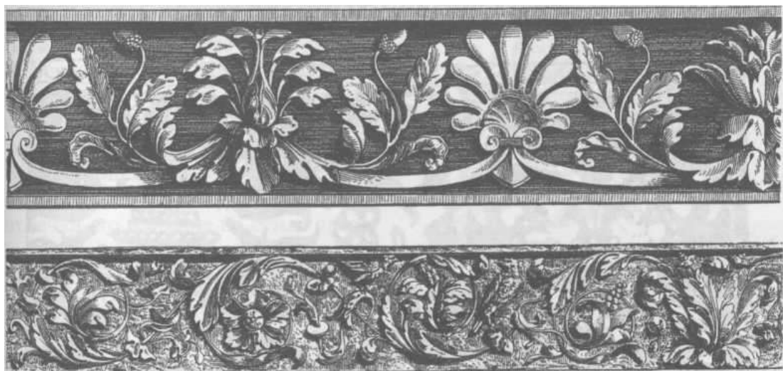
Figura 4. Decorațiuni vegetale din secolul XVI care au influențat designul ornamentelor textile

Flora locală este reflectată în mod realist în multe modele florale țesute din Florența în secolul al XVI-lea. Pictorii au introdus, de asemenea, elemente de tridimensionalitate în textilele din epoca Renașterii, îmbogățindu-le astfel foarte mult ( Figura 4 ).