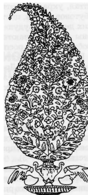
Figura 3. Motive vegetale în arta Indiei Antice